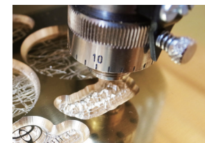
コンピューター彫刻機