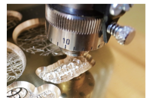
コンピューター彫刻機